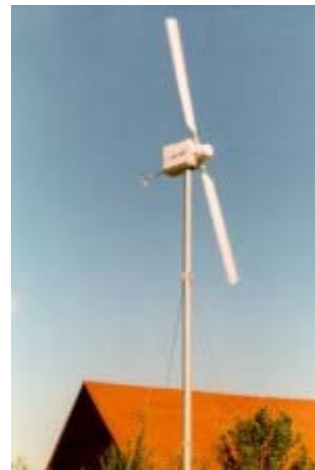
Abb. Kleinwindanlagen im Kanton Zürich: Marthalen, Winterthur und Hettlingen